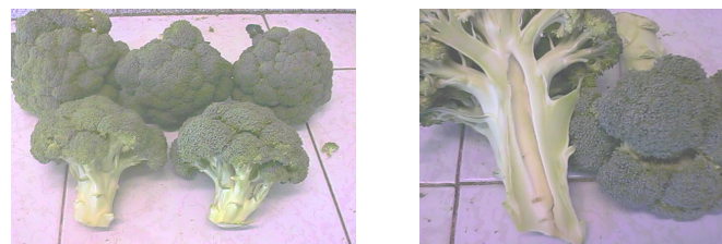
OBSERVACIONES DEL EVALUADOR MATERIAS PRIMAS COVEMEX:

1 era evaluación Cabezas medianas con uniformidad, tallo huecos con café en algunas cabezas en medio café oscuro con verde limón.