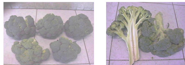
OBSERVACIONES DEL EVALUADOR MATERIAS PRIMAS COVEMEX:

Producto flácido con malformación, tallos huecos (café), florete con pzas café con color verde opaco. Con incidencia de 1 pupa en florete y 1 gusano dorso diamante.