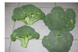
TRATAMIENTO MM-2001 ESTE CICLO: PRODUCTO BUENO CON CABEZAS CHICAS