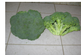
TESTIGO MM CICLO ANT.: PRODUCTO BUENO