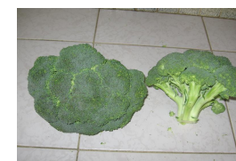
TESTIGO 1: PRODUCTO CON MAL FORMACION Y CON AMARILLO CENTRO.